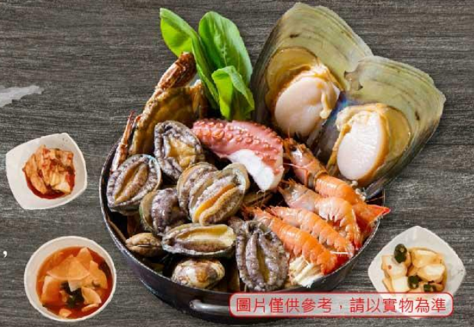
圖片僅供參考，請以實物為準