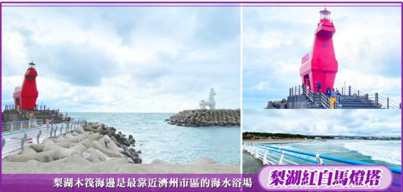
梨湖木筏海邊是最靠近濟州市區的海水浴場