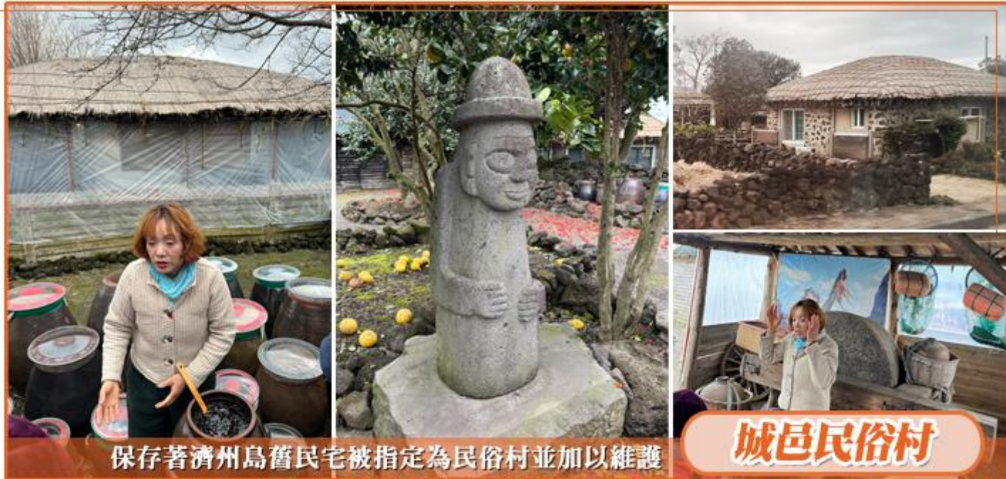
保存著濟州島舊民宅被指定為民俗村並加以維護