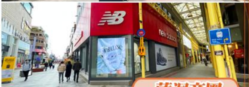
匯聚了新羅免稅店，街上美妝店、體育用品店、鞋店等林立