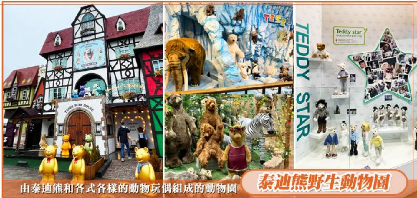
由泰迪熊和各式各樣的動物玩偶組成的動物園