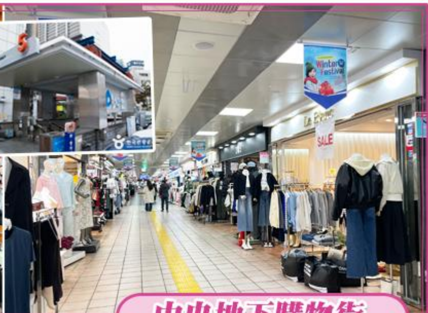
濟州島唯一的地下商街，最舒適熱鬧的購物點