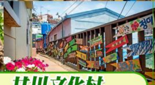
完美展示繽紛柔和色調