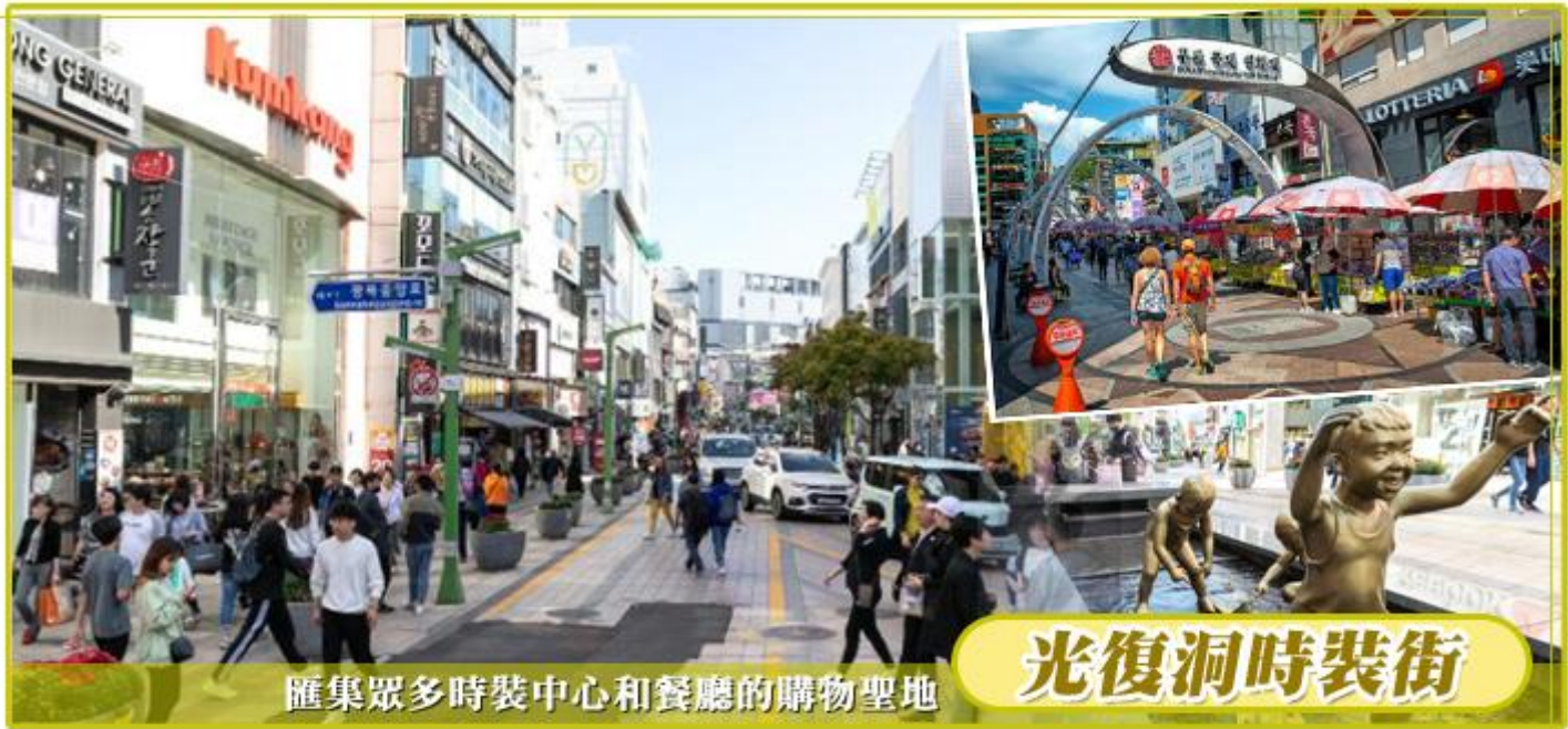
匯集眾多時裝中心和餐廳的購物聖地