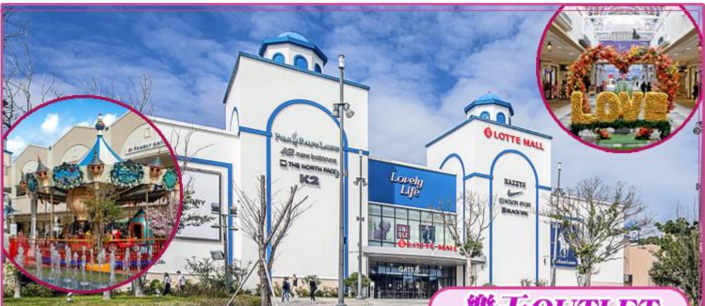
500多個國內外知名品牌和美麗的戶外景觀