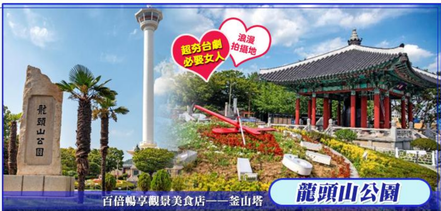
百倍暢享觀景美食店——釜山塔