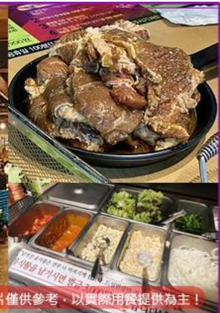
圖片僅供參考，以實際用餐提供為主！