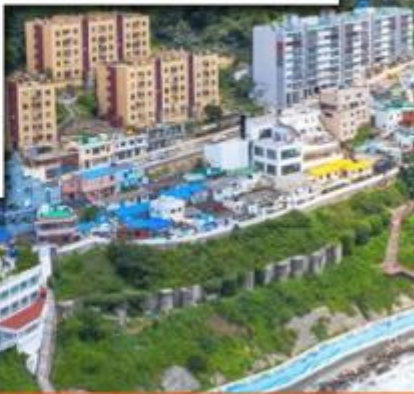
絕影海岸散步路獨特的村莊風景