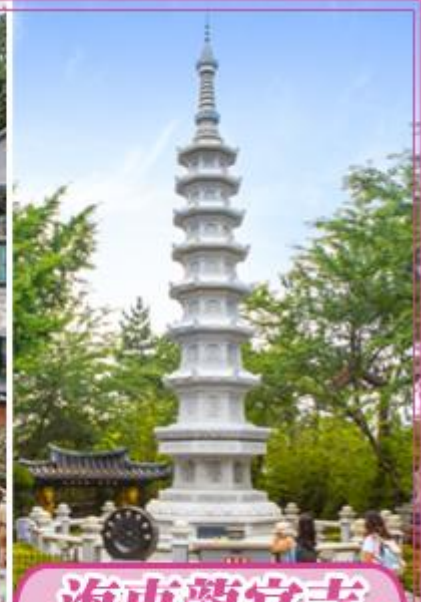
韓國三大觀音聖地之一。結合海、龍與觀音大佛有更深信仰意義