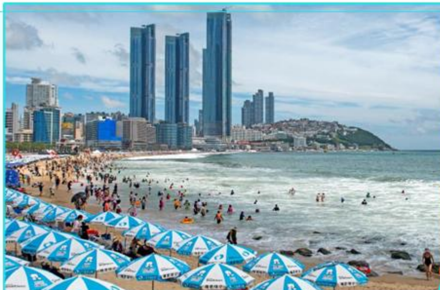
被稱為“釜山海的代表”娛樂設施和配套設施齊全