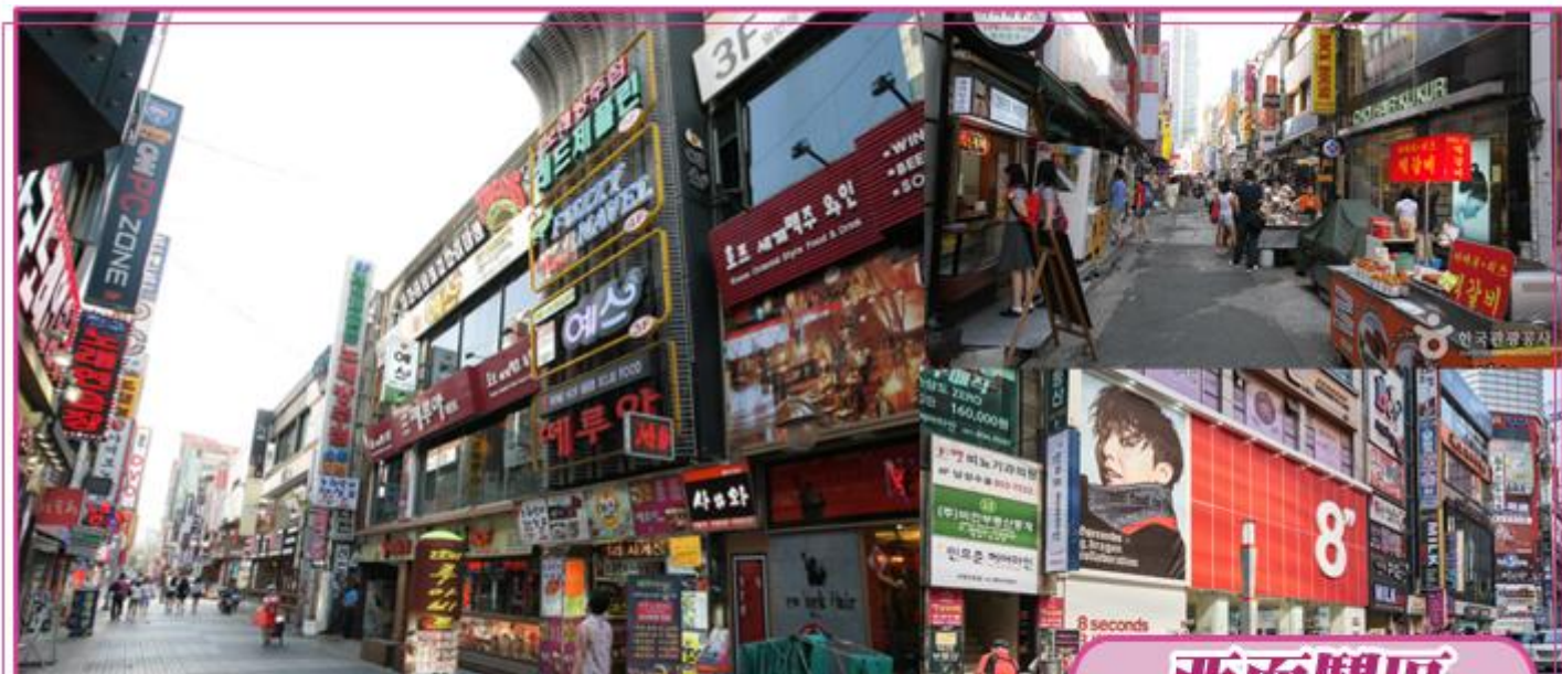
是西面繁華的街道，以‘藝術街’聞名