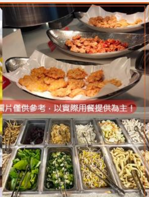
圖片僅供參考，以實際用餐提供為主！